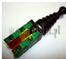
Przełącznik typu Joystick 2 pozycyjny NO Lovato

Opis: Przełącznik typu Joystick 2 pozycyjny NO z samopowrotem typ 8 LM2T J210. Liczba zestyków pomocniczych 2 szt. Waga 0,082 kg. Przełącznik wyposażony w blokadę mechaniczną przed uruchomieniem