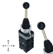
Przełącznik Joystick OFF + 4x NO chwilowy

Opis: Przełącznik typu Joystick OFF + 2 pozycje NO, manipulator, położenia chwilowe. Długość całkowita 12 cm ( LA139 ZD2-PA22 )