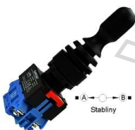
Przełącznik Joystick OFF + 2x NO stabilny

Opis: Przełącznik; joystick; D300X-R1; potencjometryczny; 10kOhm; 360°; monostabilny; przewlekany (THT); 50mA; 12V DC; 3 tor; raster 32,5mm; Ro