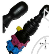
Przełącznik Joystick OFF + 4x NO chwilowy

Opis: Przełącznik joystick, pozycja spoczynkowa + 4- pozycje, chwilowe styki NO, Pozycje 4x NO + OFF, manipulator. Całkowita długość z zestykami 13,67cm ( CM707DJ41 prod. Emas ). Dźwignia manipulatora krótka.