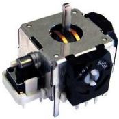
Przełącznik Joystick + potencjometry JV1603N-B 10k