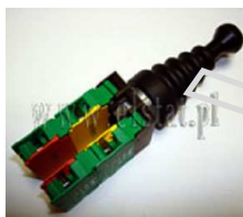
Przełącznik typu Joystick 2 pozycyjny NO Lovato

Opis: Przełącznik typu Joystick 4 pozycyjny NO bistabilny typ 8 LM2T J401. Liczba zestyków pomocniczych 4 szt. Waga 0,104 kg