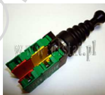
Przełącznik typu Joystick 4 pozycyjny NO Lovato

Opis: Przełącznik typu Joystick 4 pozycyjny NO bistabilny typ 8 LM2T J411. Liczba zestyków pomocniczych 4 szt. Waga 0,104 kg. Przełącznik wyposażony w blokadę mechaniczną przed uruchomieniem