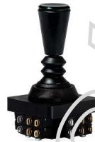
Joystick 250 V/AC TH, blokada, styki lutowane

Opis: Gałka do przełącznika typu Joystick JV1603