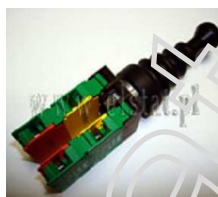
Przełącznik typu Joystick 2 pozycyjny NO Lovato

Opis: Przełącznik typu Joystick 2 pozycyjny NO bistabilny typ 8 LM2T J211. Liczba zestyków pomocniczych 2 szt. Waga 0,082 kg. Przełącznik wyposażony w blokadę mechaniczną przed uruchomieniem