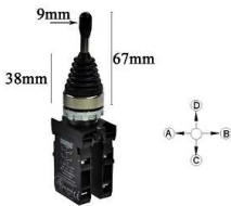
Przełącznik Joystick OFF+ 4x NO chwilowy CM707DJ41

Opis: Przełącznik joystick, pozycja spoczynkowa + 4- pozycje, bistabilny; styki NO, Pozycje 4x NO + OFF, manipulator. Całkowita długość z zestykami 13,67cm ( CM707DJ40 prod. Emas ). Dźwignia manipulatora krótka.