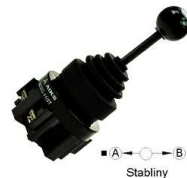
Przełącznik Joystick OFF + 2x NO stabilny

Opis: Przełącznik; joystick; ON-OFF-ON; 3 pozycje; bistabilny; śrubowe; 10A; 250V AC; 2 tor; 22mm; Aiks; RoHS ( ACS02-11/2T ).