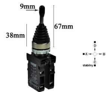
Przełącznik Joystick OFF+ 4x NO stabilny CM707DJ40

Opis: Przełącznik joystick, pozycja spoczynkowa + 3- pozycje, chwilowe styki NO, Pozycje 2x NO + OFF, manipulator. Całkowita długość z zestykami 13,67cm ( CM101DJ21 prod. Emas ). Dźwignia manipulatora krótka.