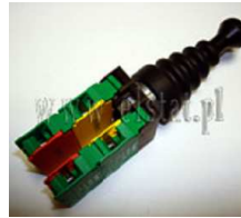
Przełącznik typu Joystick 4 pozycyjny NO Lovato

Opis: Przełącznik typu Joystick 4 pozycyjny NO z samopowrotem typ 8 LM2T J410. Liczba zestyków pomocniczych 4 szt. Waga 0,104 kg. Przełącznik wyposażony w blokadę mechaniczną przed uruchomieniem