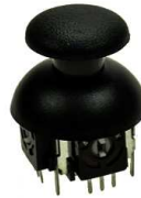
Przełącznik Joystick + potencjometry SW11

Opis: Przełącznik Joystick z potencjometrami 10K ( 2szt) + mikroprzełącznik JV1603N-B10k. Przełącznik joystick z gałką.