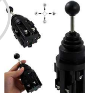
Przełącznik Joystick OFF + 4x NO chwilowy

Opis: Przełącznik joystick 2- pozycyjny + OFF, chwilowe styki NO, manipulator. Całkowita długość z zestykami 12,5 cm ( MS2P HKB-201 ). Przełącznik joystick 2P MS-2P chwilowy HKB 201 Otwór montażowy: fi30mm