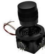
Przełącznik Joystick + potencjometr 10K 360st

Opis: Przełącznik joystick 2-pozycyjny bistabilny bez styków GIOVENZANA PMJN8T