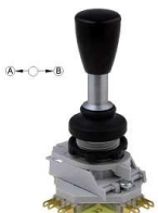
Przełącznik Joystick OFF + 2x NO, 2x NC; chwilowy

Opis: Przełącznik; joystick; 2x( ON )-OFF-2x( ON ); 5 pozycji; monostabilny; śrubowe; 10A; 250V AC; 4 torry; 30mm; ( Firma Howo) RoHS ( MS-4P HKB-402 )