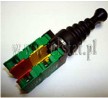
Przełącznik typu Joystick 4 pozycyjny NO Lovato