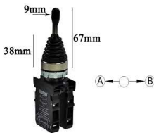
Przełącznik Joystick OFF+ 2x NO chwilowy CM101DJ21