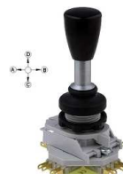
Przełącznik Joystick OFF + 4x NO, 4x NC chwilowy

Opis: Joystick 2- pozycyjne; Wyprowadzenia: konektory 2,8x0,5mm; 6A/250VAC, styki NO/NC.